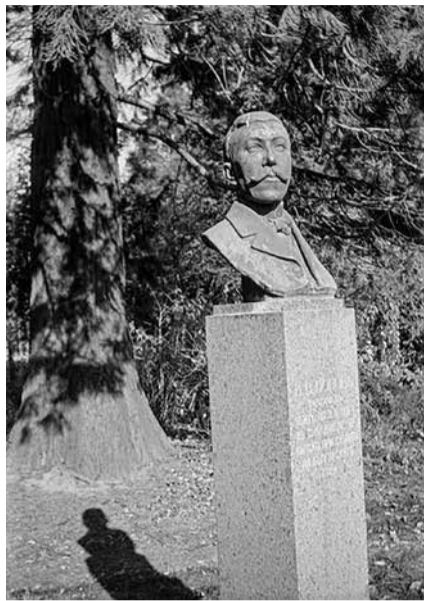
Бюст-паметникът на Васил Попов, открит през 1934 г., и състоянието след 1992 г.

Васил Попов е роден на 15 октомври 1879 г. в Стара Загора. Завършва през 1899 г. лесовъдство в Горската академия в Лемберг, Австро-Унгария (сега Львов, Украйна). Служи в различни горски служби в България – Провадия, Радомир, Батак, Станимака (Асеновград), с. Лъджене и други. Служейки на Българската гора, е безкомпромисен към посегателствата върху нея, включително и чрез материалите в издаваното от него със собствени средства списание „Бранище“, в което клейми алчните търговци, контрабандисти на дървесина и дори високопоставени държавни ръководители, посягащи на националното богатство. На 2 февруари 1912 г. младият му живот е прекъснат от ръката на наемен убиец в с. Лъджене (сега