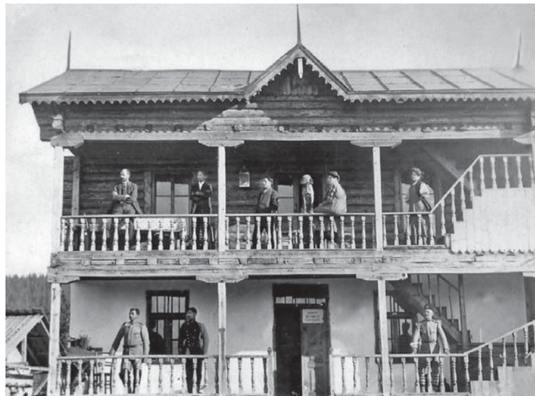
Лесничейски дом през 1911 г.

Историята на изграждането на Лесничейския дом е разказана в книгата на проф. Никола Колев „Университетската гора“ и не случайно при символичното откриване на музея, станало по време на Седмичата на гората на 4 април 2017 г., доайенът на лесовъдската колегия бе много развълнуван. Той определи създаването на Националния горски музей на Юндола като