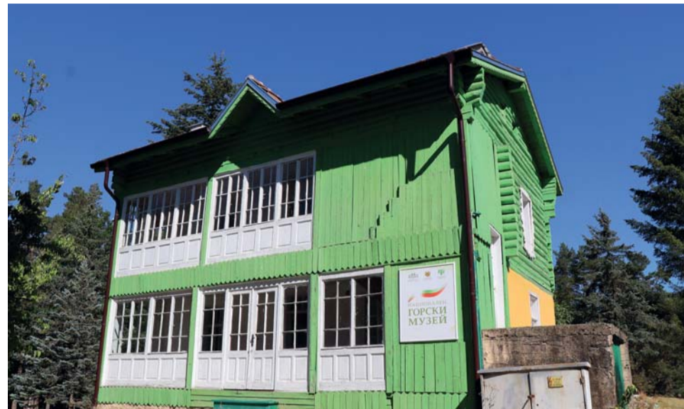
Ремонтирана сграда за музея през 2017 г.