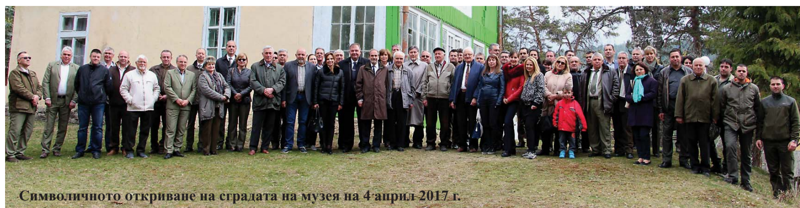
Символичното откриване на сградата на музея на 4 април 2017 г.